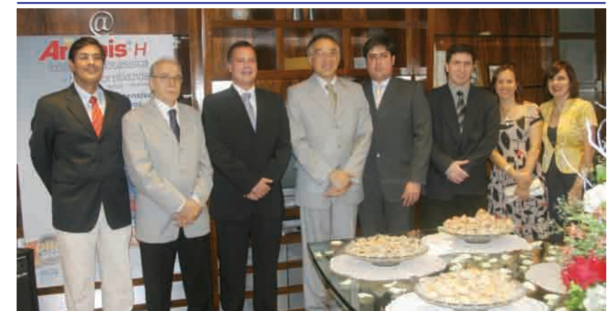
Os atuais diretores foram eleitos para um mandato de dois anos, que inicia em 2008