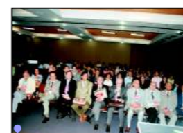
Auditório lotado prestigia a abertura do congresso