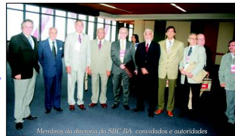
Membros da diretoria da SBC-BA, convidados e autoridades