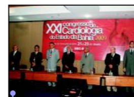
Mesa composta por membros da diretoria da SBC, SBC-BA, e entidades médicas