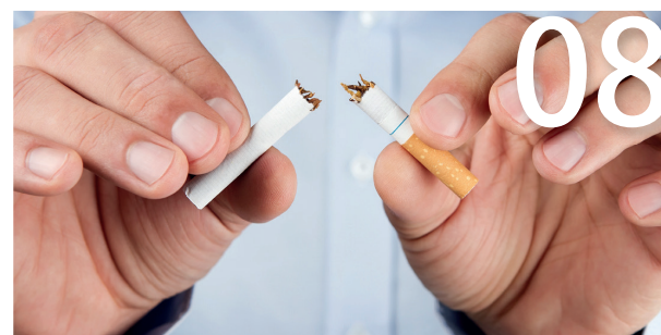
Tratamento farmacológico anti-tabagismo na fase aguda do IAM – Estudo Evita