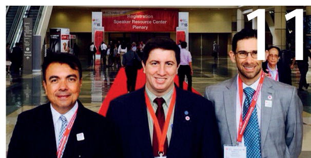
Cardiologistas baianos marcam presença na American Heart Association 2015