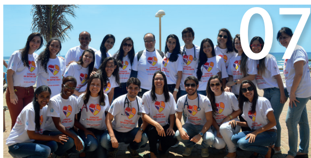
Campanha Coração na Batida Certa oferece serviços à população