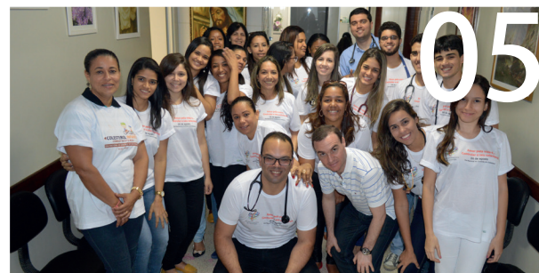
SBC-BA e Fundação Lar Harmonia realizam ação de saúde comunitária