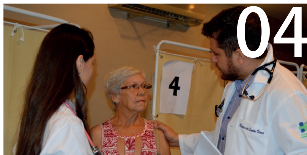
Parceira entre ABM e SBC-BA realiza mutirão contra doenças cardiovasculares