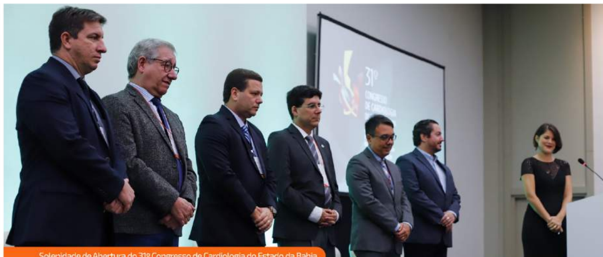
Solenidade de Abertura do 31º Congresso de Cardiologia do Estado da Bahia.

O 31º Congresso de Cardiologia do Estado da Bahia, realizado em maio, teve um brilho especial em novo cenário - a Praia de Itapuã. O local que antes tinha sido motivo de insegurança para a diretoria e organização do evento devido à localização, surpreendeu positivamente.