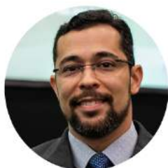
Diretor de Comunicação: Fábio Luís de Jesus Soares