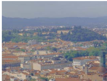
Vista bucólica da cidade de Florença, capital toscana.

“Agora que a velhice começa preciso aprender com o vinho a melhorar envelhecendo, e sobretudo, escapar do perigo terrível de... envelhecendo ... virar vinagre.” Dom Helder Câmara