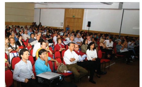
O Congresso Fluminense de Cardiologia reúne mais de 800 médicos