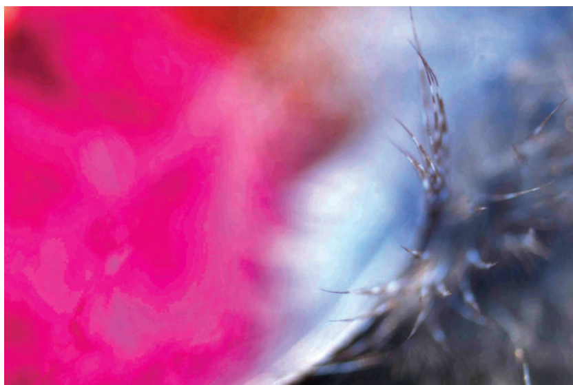
brinco de penas