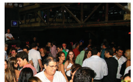
Festa de encerramento, um brinde ao Dia do Médico