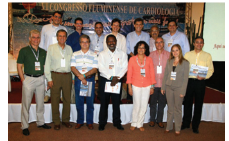
A Comissão Organizadora do 6º Congresso Fluminense de Cardiologia

Envie seus Temas Livres até 20 de setembro