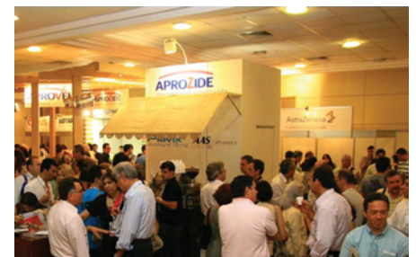
Mais de 20 parceiros da indústria farmacêutica presentes ao local