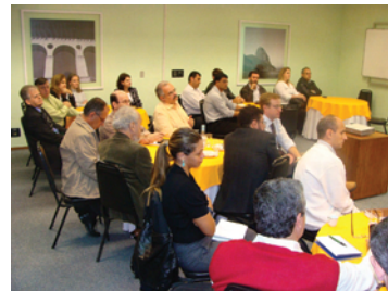
Flagrante do Café da Manhã envolvendo a SOCERJ e seus parceiros

No último dia 25 de agosto, a SOCERJ realizou reunião com representantes de empresas e hospitais que apoiam nossa Sociedade. Foram expostos os planos de ação da atual diretoria e as inúmeras oportunidades de patrocínio disponíveis em todas nossas atividades e publicações científicas. Todos os presentes ressaltaram a importância da iniciativa, deram sugestões e demonstraram vivo interesse em conhecer melhor e contribuir com a SOCERJ, solicitando reuniões individuais.