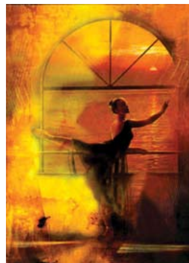
Dançando ao crepúsculo