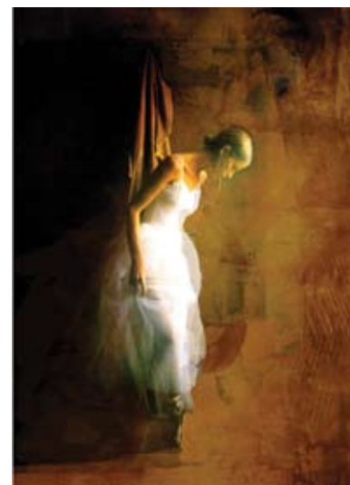
A bailarina descalça