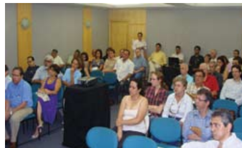
Flagrante do encerramento do 9º PEMC em Niterói