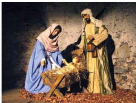
Jogo da fraternidade