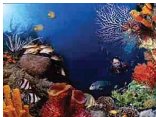
Um mergulho em Arraial